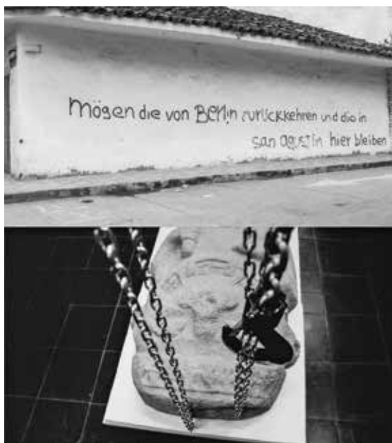
Julián Santana El Dilema de Preuss es el Monumento a Humboldt , 2018 Video + Instalación Video 1: 00:12:30 Video 2: 00:05:42 Video 3: 00:08:30 Dimensiones variables