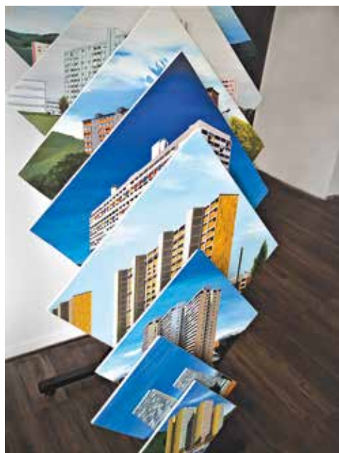
Esteban López Escobar La repetición es solo una estrategia , 2018 Instalación Dimensiones variables