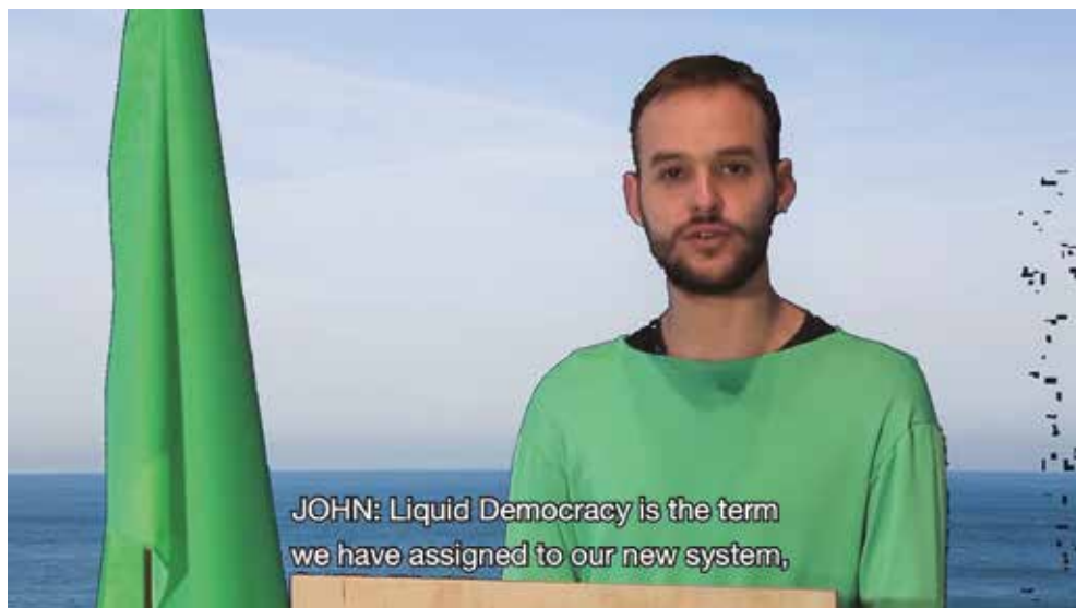
Juan Pablo Pacheco Democracia Líquida , 2018 Videoinstalación 00:14:06